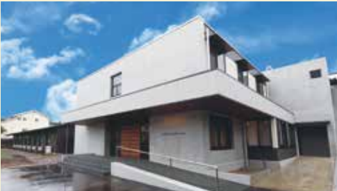
アークユ芦野倶楽部 ゲスト専用エントランス

ここでは新たな交流が生まれ、仲間と趣味を愉しみ、笑顔あふれるくつろぎの日々が続いていく。上質で多様な共用空間と、専属シェフが振る舞う那須拘りのお食事。バーラウンジではグランドピアノを聴きながら、ウイスキーやカクテルなども堪能できます。また併設のクリニックや介護体制も整っているため、ライフスタイルが変わる将来も安心です。施設の目の前には「現代の湯治場」として全国的に有名な芦野温泉があり、健康増進・維持のために連携した運営を行っています。「安心」「安全」「快適」が揃うこの場所で、やすらぎの日々を送りませんか。