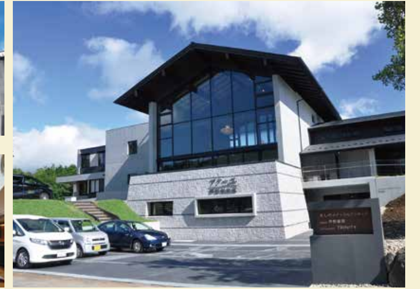
アークユ芦野倶楽部 外観