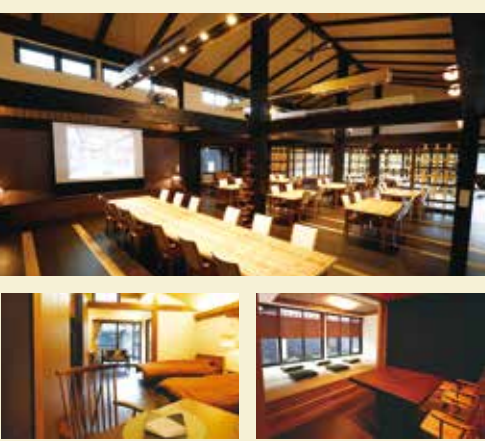
アークユ芦野倶楽部 オナーズサロン「アダムス」