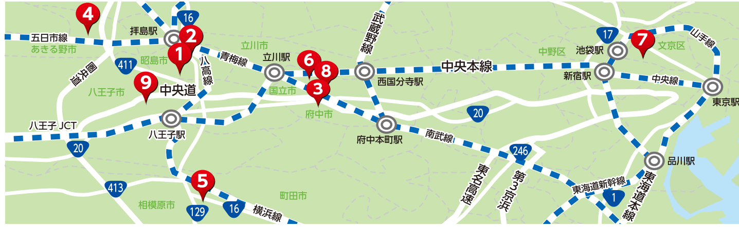
介護老人保健施設 アゼリア アネックス