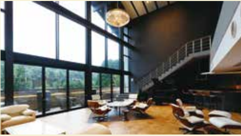
アークユ芦野倶楽部 オーナーズサロン「アダムス」