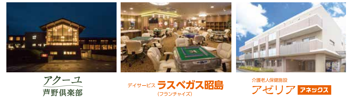
アークユ 芦野倶楽部

※「生涯活躍のまち」構想とは、「東京圏をはじめとする地域の高齢者が、希望に応じて地方や「まちなか」に移り住み、地域住民や多世代と交流しながら健康でアクティブな生活を送り、必要に応じて医療・介護を受けることが出来るような地域づくり」を目指すものです。