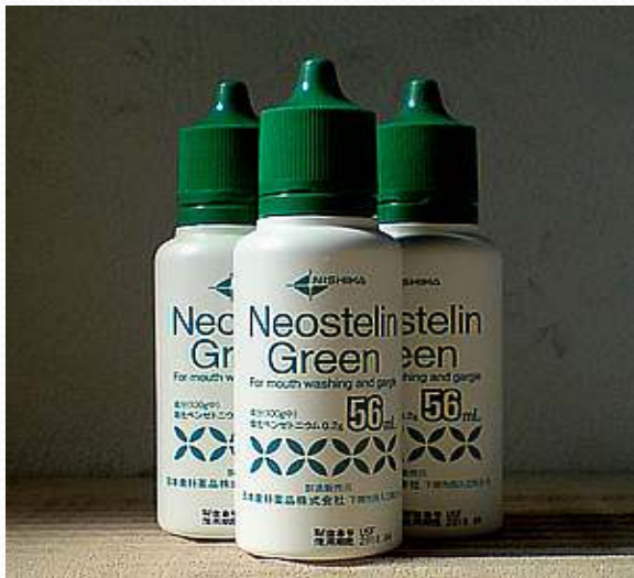
ネオステリングリーン