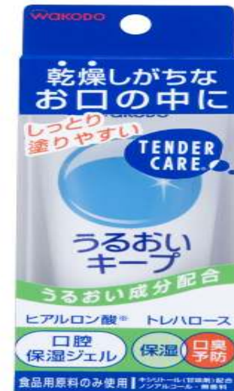
和光堂うるおい保湿ジェル うるおいキープ